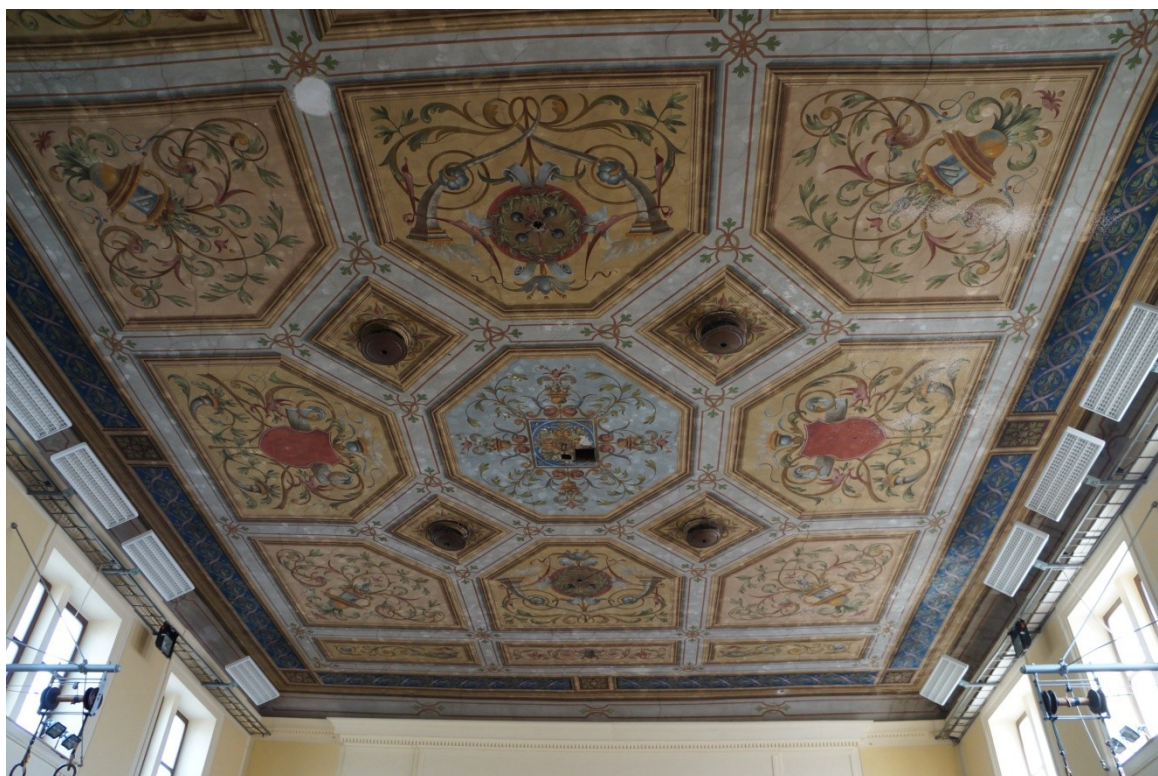
- původní strop -

Ted' je třeba vysvětlit cvičící mládeži význam těchto slov a naučit se podle nich žít!